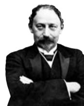
EDVARD BRANDES (1847-1931) STIFTER AF POLITIKEN I 1884