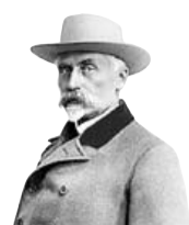
VIGGO HØRUP (1841-1902) STIFTER AF POLITIKEN I 1884

3 læserbreve og debatindlæg handlede om Socialdemokraterne